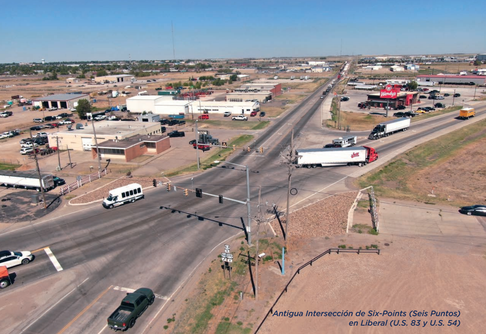
Antigua Intersección de Six-Points (Seis Puntos) en Liberal (U.S. 83 y U.S. 54)

ACERCA DE IKE IKE—El Eisenhower Legacy Transportation Program (Programa de Transporte del Legado Eisenhower)—es una inversión de aproximadamente $10 mil millones en el futuro de Kansas. Este programa y las mejoras de transporte que brindará mejorará la seguridad, modernizará la infraestructura y generará empleos por todo Kansas.